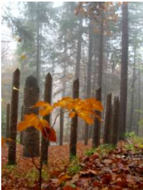
Arte Sella: Tempio dell'Amore

Ho trovato uno spazio sacro del tutto particolare in Trentino. Ad Arte Sella 39 in Valsugana decine di artisti hanno creato delle sculture, usando esclusivamente materiali naturali, quelli che sono riusciti a trovare sul posto: rami, tronchi e pietre. Il luogo ha qualcosa di sacro che va ben oltre una semplice esposizione d'arte. La visita mi ha fatto