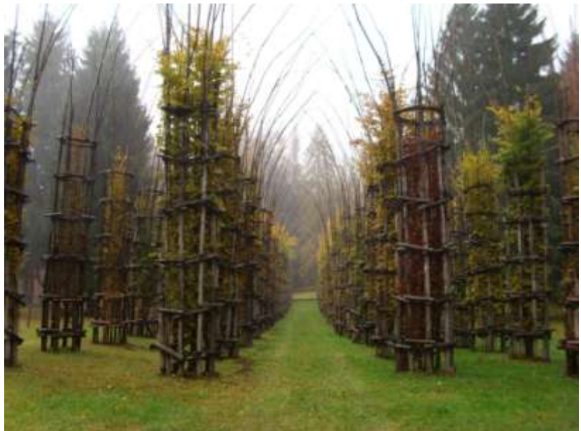
Cattedrale degli alberi